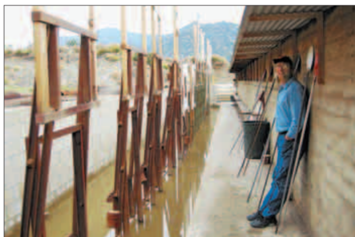
Die Umgebung des neuen Schiessstandes der Swiss Athletic Society erinnert etwas an den «Wilden Westen».