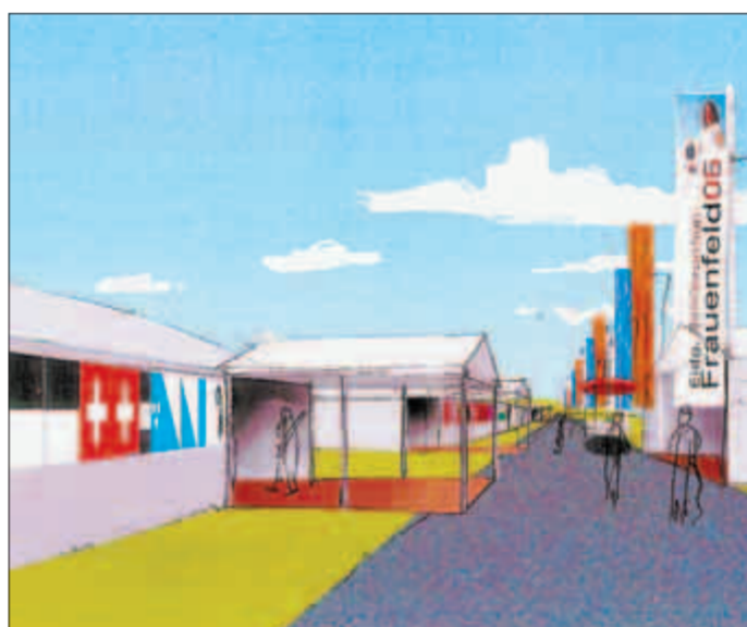
Nicht nur das Festgelände, auch die ganze Stadt Frauenfeld ist geschmückt mit bunten Fahnen und Flaggen.