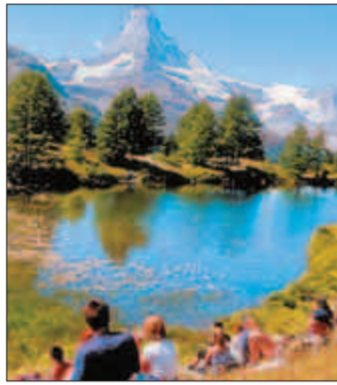
Das Wallis: Ein wahres Wanderparadies.

Der Thurgauer Partnerkanton präsentiert sich und seine Produkte und trägt massgeblich zur Feststimmung in der Innenstadt bei.