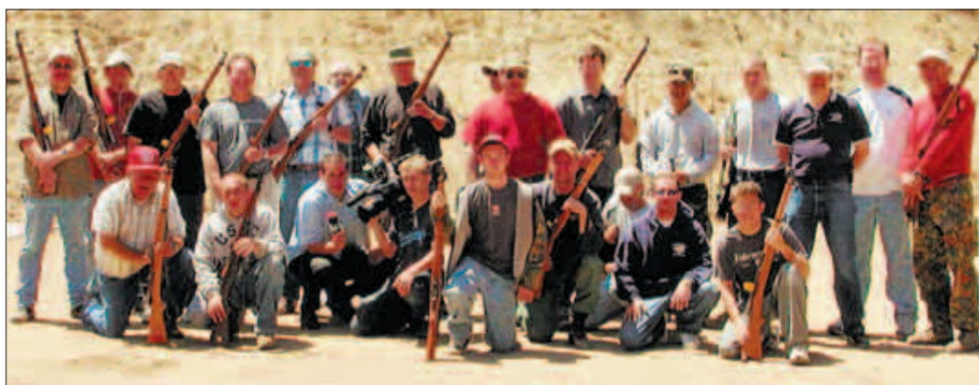
Stolz posieren die Mitglieder des Monterey-County-Swiss-Rifle-Clubs auf dem Gruppenbild.

Der Club wurde im Jahr 1900 von Auswanderern aus dem Tessin gegründet. Sie kamen zur Hauptsache aus dem Maggia- und Verzascatal und bestritten den Lebensunterhalt in der Milch- und Landwirtschaft. Der Club soll einer der ältesten Rifle-Clubs der USA sein. Während der über 100-jährigen Vereinsgeschichte stand das Gesellschaftliche stark im Vordergrund. Auslandschweizer aber auch Angehörige anderer Nationalitäten treffen sich im Club zu verschiedensten Veranstaltungen und bege-