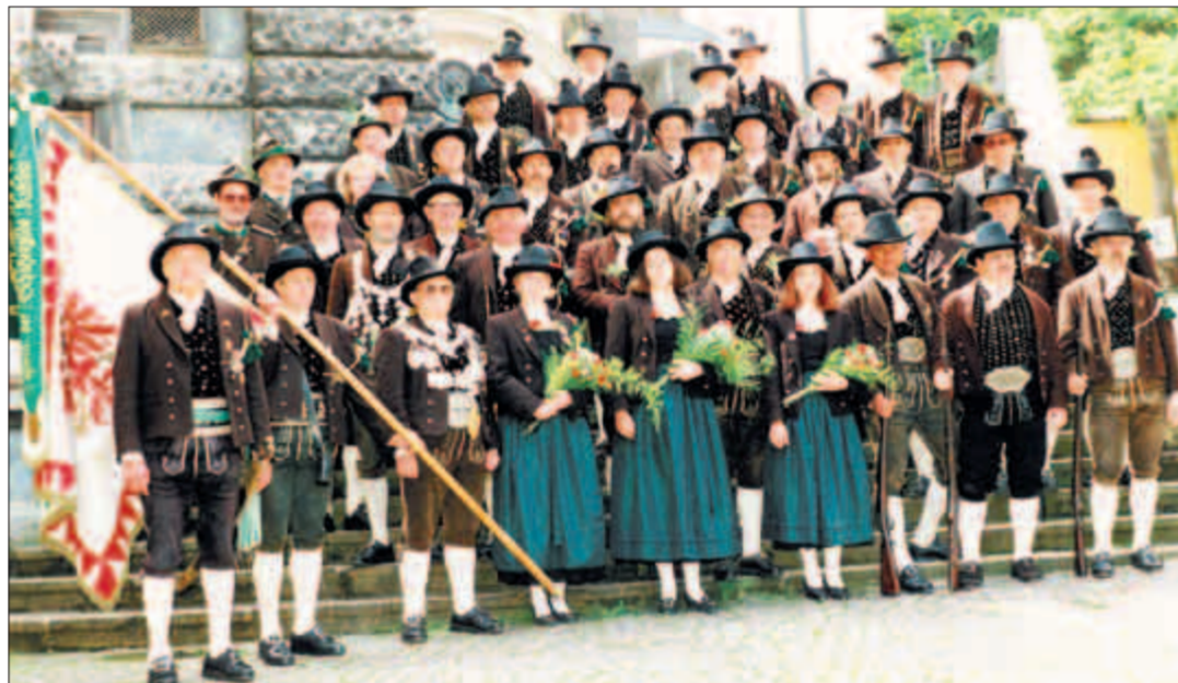
Eine starke Schützen-Delegation aus Kufstein lässt es sich nicht entgehen, am Eidgenössischen Schützenfest in der Partnerstadt farbenfrohe Akzente zu setzen.

Die Kufsteiner Schützen pflegen eine Tradition, wie sie in dieser Form in der Schweiz kaum anzutreffen ist. Neben den Schützen an ordentlichen Schiess-Wettkämpfen bietet die Schützenkompanie, eine in Tiroler Tracht zusammengesetzte