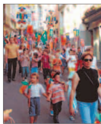
Gelebte Schützentradition: Der «Steckliträge-Samschtig» in Wil.

Bis 1899 schossen die «Wiler Böcke» wie sie auch genannt wurden, vom alten Schützenhaus über den Stadtweier an den «Schii-beberg». Obrigkeit und Gewerbetreibende dankten den Stadtschützen jeweils mit Gaben zum Endschiessen. Um dies der Bevölkerung zu zeigen, wurde erstmals 1665 das «Steckliträge» durchgeführt. Schulkinder tragen die Endschiessgaben an Steckli gebunden durch die Stadt. Mit einem farbenprächtigen Um-