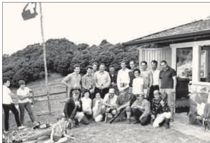
Sie hält die Schweizer Fahne in Neuseeland hoch: Die Schützen-Sektion Auckland.

1961 fand der erste Kleinkaliber-Wettkampf über 25 Meter statt. Im gleichen Jahr wurde die 50-Meter-Anlage gebaut. Der langjährige Wunsch der Schützen war der Bau einer 300-Meter-Schiessanlage und gleichzeitig der Wechsel zum Karabiner als Schusswaffe. Heute