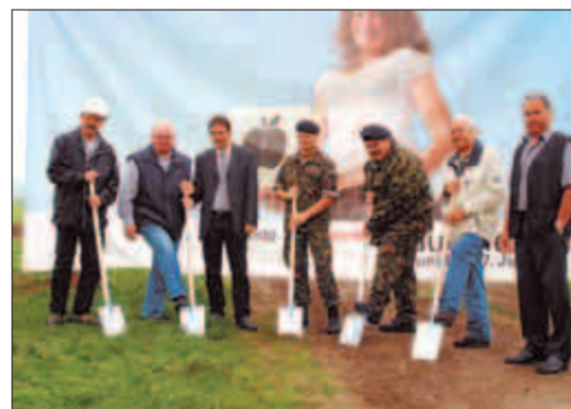
Der Spatenstich von Anfang Oktober war der symbolische Startschuss für die verschiedenen Vorbereitungsarbeiten im Bereich Tiefbau.

Die wichtigsten Vorbereitungsarbeiten in den Sparten sind abgeschlossen. Das Erstellen eines Detailterminplanes bildet das Kernstück der laufenden Arbeiten, denn auf das Infrastrukturteam wartet noch ein grosses Stück Arbeit bis zum Eröffnungsschiessen vom 18. Juni.